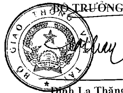
Đinh La Thăng